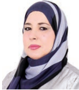
د. مريم إبراهيم.

ترأست الدكتورة مريم إبراهيم الهاجري الوكيل المساعد للصحة العامة وفد مملكة البحرين المشارك في الدورة الخمسين بعد المائة للمجلس التنفيذي لمنظمة الصحة العالمية المنعقدة افتراضياً خلال الفترة ٢٤-٢٩ يناير ٢٠٢٢م.