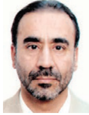
لقلم: إسماعيل محمد المدني

إضافة، وكأنه لم توجد مسرطنات وسموم جديدة تعتمد في بيئتنا منذ ذلك الوقت، وتستحق أن تدخل في هذه القائمة طوال أكثر من ثلاثة عقود. فمن هذا المثل وأمثله كثيرة أخرى أستطيع أن أصل إلى استنتاجات مهمة جدا حول كيفية تعامل الإنسان مع ملوثات بيئته الضارة بصحته، وهي كما يلي: أولا: الإنسان يتبنى المدخل «الواقعي والعلمي» وليس المنهج والمدخل العلمي المبني على الأبحاث عند التعامل مع المواد الاستهلاكية التي قد تعد بعضها ملوثات بيئية في الوقت نفسه، فإذا لم يجد البديل المناسب، فإنه يسمح لهذه الملوثات والسموم من الاستمرار والأضرار بالصحة المهنية والعامية، ويحدد تركيزها، أو نسبة انبعاثها بما يطلق عليه «الحد المسموح به»، ما يعني عمليا بأننا طواعية أطلقنا سراح الملوثات بنسب منخفضة، ولكنها ضارة ومهددة للصحة.